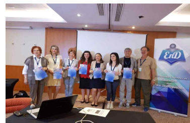
[학술대회에 참가한 해외학자들]