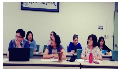
[특강을 듣고 있는 대학원생들]