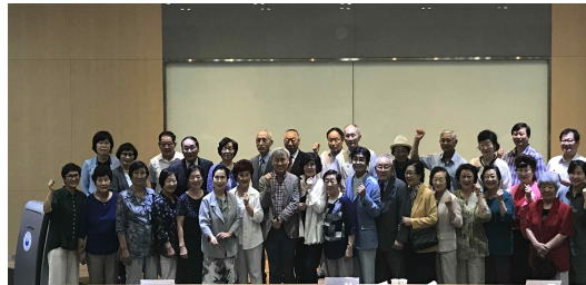
[사할린 경로당 어르신들과 단체사진]