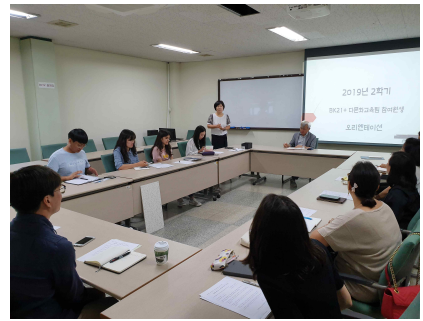
[BK 참여원생 오리엔테이션]