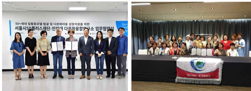
[서울시50+재단, 국제결혼여성총연합회와 업무협약식]

2019년 10월 8일 오후 5시에 서울 여의도 글래드 호텔에서 재외한인여성 연구 및 사회의 변화에 따른 다문화교육 수요자의 요구에 부응하고자 월드킴와(국제결혼여성총연합회)와의 업무협약을 체결하였습니다. 양 기관은 상호 정보교류와 협력을 강화해 이주의 시대 건강한 이주에 대한 국가간 논의를 이끌어내고 올바른 교육 프로그램 및 수준 높은 교류서비스가 제공될 수 있도록 추진해 나갈 예정입니다.