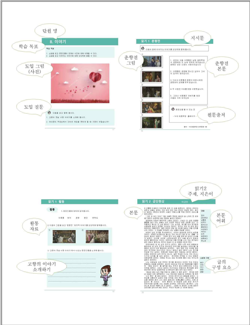
<그림 2-1> 단원8 모형 실제