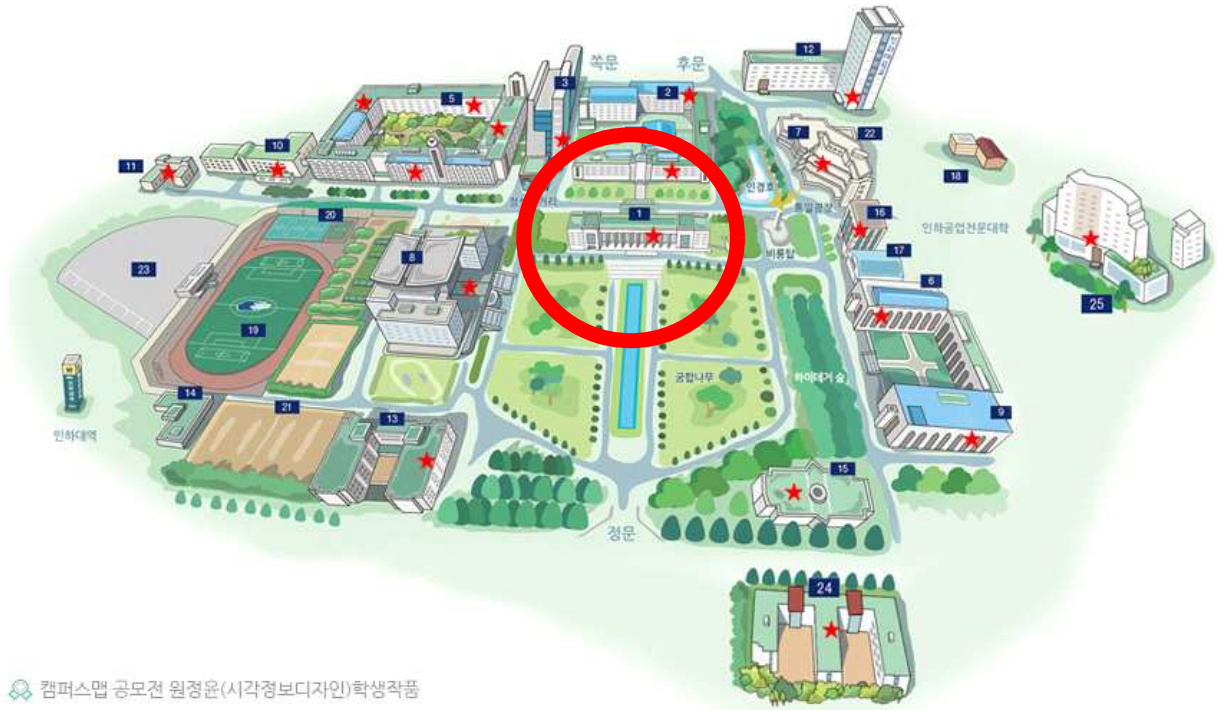
캠퍼스맵 공모전 원정운(시각정보디자인)학생작품